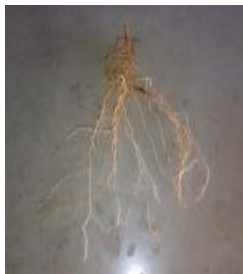
ج) آبیاری بدون PRD بدون تیغه