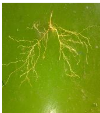
ب) آبیاری PRD با تیغه