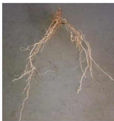
ب) آبیاری PRD با تیغه