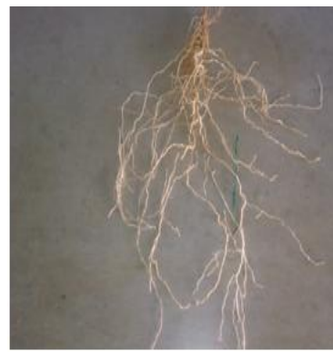
الف) آبیاری کامل