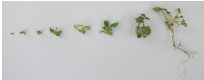
شکل ۴. مراحل رشد توت‌فرنگی رقم سلوا از مرستم تا گیاه کامل