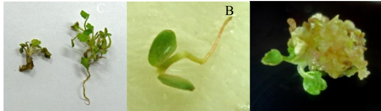
شکل ۱. (A) برگ‌های لپه‌ای و هیپوکوتیل، (B) گیاه حاصل از باززایی مستقیم هیپوکوتیل و (C) باززایی غیر مستقیم هیپوکوتیل