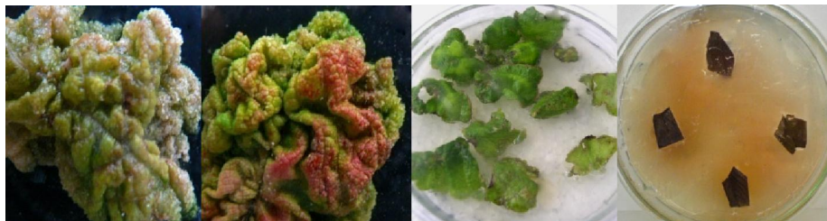
شکل ۲. (A) ترشحات فنولی آزاد شده از برگ‌های گلخانه‌ای پس از ۲۴ ساعت، (B) جذب مواد فنولی توسط آنتی‌اکسیدان، (C) آغاز کالوس‌زایی در ریزنمونه برگ و (D) کالوس‌دهی ریزنمونه برگ

ناشناخته بوده و به سختی فراهم می‌شود (۴).