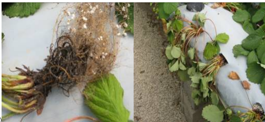
شکل ۱. الف) گیاهچه توت فرنگی در حال پژمردگی در کشت هیدروپونیک در گلخانه و ب) پوسیدگی ریشه گیاهچه توت فرنگی