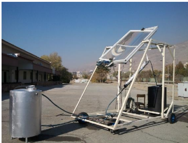
شکل ۲. متمرکزکننده خورشیدی با عدسی فرسنل خطی

که T_s^+ , T_s دماهای مخزن در یک ساعت متوالی ( ^{\circ}\text{C} )، \Delta t بازه زمانی ( h )، m جرم آب ( kg )، C_p ظرفیت گرمایی آب ( \text{kcal}/\text{kg}\cdot^{\circ}\text{C} )، Q_u آهنگ اضافه نمودن انرژی توسط متمرکزکننده ( \text{kcal}/h )، L_s آهنگ برداشت انرژی توسط مصرف کننده ( \text{kcal}/h )، U ضریب هدایت مخزن ( \text{kcal}/\text{m}^2\cdot h\cdot^{\circ}\text{C} )، A_s سطح خارجی مخزن ( \text{m}^2 ) و \Delta T = T_s - T_a اختلاف دمای محیط و داخل مخزن ذخیره آب ( ^{\circ}\text{C} ) است.