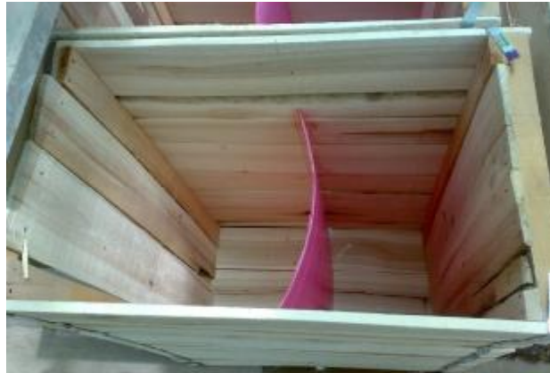
شکل ۱. جعبه چوبی و تیغه وسط آن برای آزمایش PRD