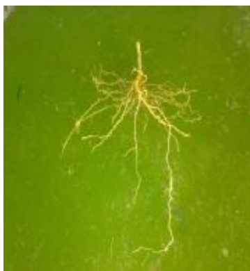
ج) آبیاری بدون PRD بدون تیغه